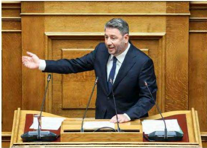
Κατά τη χθεσινή ομιλία του στην Ολομέλεια, ο Νίκος Ανδρουλάκης απέκλεισε για άλλη μία φορά σενάρια και συζητήσεις για πιθανή μετεκλογική συνεργασία του ΠΑΣΟΚ με τη Νέα Δημοκρατία.

«Η απροθυμία του να ασχοληθεί με ένα σκάνδαλο κατασκοπείας εις βάρος της Ελλάδας αποδεικνύει ότι αυτός είναι πίσω από όλα», υπογράμμισε ο κ. Ανδρουλάκης αναφερόμενος στον Κυρ. Μητσοτάκη.