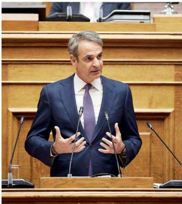
Ο Κυριάκος Μητσοτάκης, αναφερόμενος στο θέμα του ΟΠΕΚΕΠΕ χθες στη Βουλή, τόνισε ότι «κατά τα λεγόμενα σας είναι πρόβλημα διαρροές και "γαλάζιο" σκάνδαλο. Μάλιστα. Ξεκίνησε το 2019. Εμπλέκονται μόνο βουλευτές της Ν.Δ. Η χώρα έχει καταβάλει πρόσημα και επιστροφές στην Ευρωπαϊκή Επιτροπή που ξεπερνούν τα 3 δισ. για προβλήματα που ξεκινούν το '80. Εσείς δεν κυβερνήσατε καθόλου ως ΠΑΣΟΚ».

Οι υψηλοί τόνοι συνεχίστηκαν από τον Κυριάκο Μητσοτάκη, ο οποίος αφού κατήγγειλε ξανά την αντιπολίτευση για τη δημιουργία τοξικού πολιτικού κλίματος, έκανε δύο πολιτικές αναφορές απευθυνόμενος στο ΠΑΣΟΚ και στον ΣΥΡΙΖΑ. Συγκεκριμένα είπε στον κ. Ανδρουλάκη: «Στον υπονο σας αυτό που βλέπεται είναι να είναι αυτοδύναμη η Ν.Δ. για να σας βγάλει από τη δύσκολη θέση του ή να κάνει μετά τις εκλογές. Έχετε καταφέρει, ουσιαστικώς με τις πιο ακραίες φωνές τελικά, να προβάλετε μόνο το άγχος σας για την κατάκτηση της 2ης θύσης», ενώ στη συνέχεια στράφηκε κατά του ΣΥΡΙΖΑ και του Αλέξη Τσίπρα. «Βλέπεται τον αρχηγό που σας έφερε σε αυτά τα ποσοστά να σας διαλύει τώρα και να εικόνατε να κάνει άλλο κόμμα μπας και σας πάρει και διαπραχθείτε τη βουλευτική σας ιδιότητα», τόνισε.