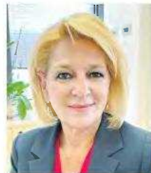
γράφει η ΘΕΑΝΗ ΚΑΡΠΟΒΑΛΗ*

«Καμία μεταρρύθμιση δεν μπορεί να χαρακτηριστεί επιτυχής εάν η ίδια ως πολιτική, ως διαχειριστική επιλογή, δεν υπηρετεί τον άνθρωπο»