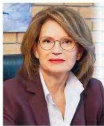
γράφει η ΕΥΑΓΓΕΛΙΑ ΚΟΡΑΚΗ*

Τελικά, το αυξημένο ενδιαφέρον για τις κλινικές μελέτες αναγκάζει μια βαθύτερη μετατόπιση από ένα μοντέλο παθητικής απορρόφησης της φαρμακευτικής καινοτομίας σε ένα μοντέλο ενεργής συμμετοχής στη διαμόρφωσή της. Για την Ευρώπη, και κατ'επέκταση για κάθε κράτος-μέλος, η κλινική έρευνα αποτελεί πλέον στρατηγικό εργαλείο για την ενίσχυση της ανταγωνιστικότητας, τη στήριξη της καινοτομίας και τη διασφάλιση της βιωσιμότητας των συστημάτων υγείας.