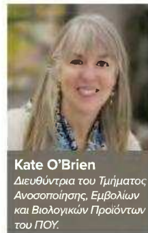
Kate O'Brien Διευθύντρια του Τμήματος Ανοσοποίησης, Εμβολίων και Βιολογικών Προϊόντων του ΠΟΥ.

Αυτές οι προτεραιότητες θα καθοδηγήσουν τις συζητήσεις στην 79 η Παγκόσμια Συνέλευση Υγείας (18-23 Μαΐου 2026). Σε έναν κόσμο που αλλάζει, η ανοσοποίηση παραμένει ένα κοινό παγκόσμιο αγαθό που σώζει ζωές, σταματά τις επιδημίες και προστατεύει τις γενιές του παρελθόντος, του παρόντος και του μέλλοντος, τονίζει η Kate O'Brien , Διευθύντρια του Τμήματος Ανοσοποίησης, Εμβολίων και Βιολογικών Προϊόντων του ΠΟΥ.