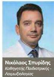
Νικόλαος Σπυρίδης Καθηγητής Παιδιατρικής - Λοιμωξιολογίας

Η αυξανόμενη αμφισβήτηση των εμβολίων αποτελεί πρόκληση για τα συστήματα υγείας παγκοσμίως. Ο Καθηγητής Παιδιατρικής - Λοιμωξιολογίας Νικόλαος Σπυρίδης , μιλώντας σε εκδήλωση του Πανελληνίου Συλλόγου Επισκεπτών Υγείας (ΠΣΕΥ/ΝΠΔΔ) με αφορμή την Παγκόσμια Εβδομάδα Εμβολιασμού 2026, επεσήμανε την αύξηση της αμφισβήτησης των εμβολίων και για τη μείωση των εμβολιασμών που τα τελευταία