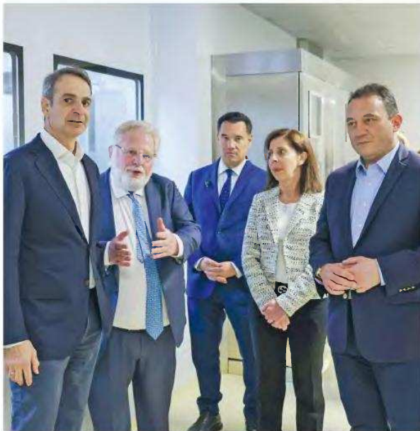
Ο πρωθυπουργός Κυριάκος Μητσοτάκης ξεναγήθηκε στις εγκαταστάσεις των εταιρειών DEMO και Win Medica παρουσία του υπουργού Υγείας, Αδωνι Γεωργιάδη, του υφυπουργού Παιδείας και Βουλευτή Αρκαδίας, Κώστα Βλάση, του περιφερειάρχη Πελοποννήσου, Δημήτρη Πτωκού, καθώς και πλήθους εκπροσώπων θεσμικών φορέων

Σε κόμβο για τη βιομηχανία φαρμάκων αναδεικνύεται η Τρίπολη, μετά τις επενδύσεις τριών ελληνικών εταιρειών