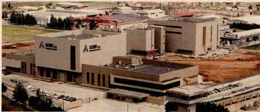
Η DEMO επένδυσε πάνω από 365 εκατομμύρια για τη δημιουργία ενός καθετοποιημένου παραγωγικού campus. Το συγκρότημα περιλαμβάνει δύο μονάδες πρώτων υλών και τρεις παραγωγής τελικών προϊόντων.

Τα έργα αυτά ενισχύουν όχι μόνον την παραγωγική αυτονομία της Ελλάδας στον ευαίσθητο τομέα του φαρμάκου, αλλά και τη χώρα συνολικά στο ευρωπαϊκό οικοσύστημα έρευνας και καινοτομίας. Τρεις κομβικοί παίκτες της εγχώριας αγοράς, οι εταιρείες DEMO, Win Medica του ομίλου ELPEN και FARAN, ολοκληρώνουν τα επενδυτικά τους σχέδια στη βιομηχανική περιοχή της Τρίπολης, παράγοντας μεταξύ άλλων δραστηκές πρώτες ύλες που απουσίαζαν από τη χώρα. Οι επενδύσεις αυτές, που εντάσσονται στο πλαίσιο της μεταρρύθμισης του συστήματος clawback (συμψηφισμός απαιτήσεων του Δημοσίου με ιδιωτικές επενδύσεις), δημιουργούν και άνω