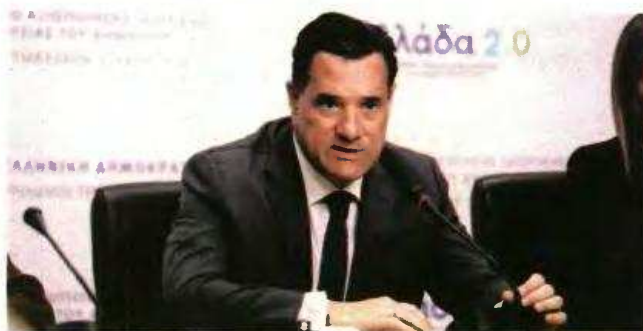
Ο υπουργός Υγείας, Άδωνις Γεωργιάδης