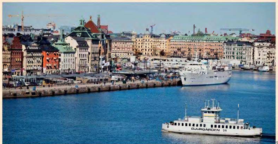
Η Σουηδία έχει συρρικνώσει το μέγεθος του κράτους, δίνοντας στην κυβέρνηση περιθώρια να μειώσει τους φόρους και να ενθαρρύνει την επιχειρηματικότητα, που εκτοξεύθηκε, όπως και η ανάπτυξη. Σύμφωνα με τις εκτιμήσεις του ΔΝΤ, η οικονομία της Σουηδίας θα σημειώνει ετήσια ανάπτυξη 2% κάθε χρόνο έως και το 2030, ρυθμό ουσιαστικά ίσο με εκείνο της αμερικανικής οικονομίας και διπλάσιο από εκείνους της Γαλλίας και της Γερμανίας.

Η υπουργός Οικονομικών Ελίζαμπεθ Σβάντεσον μειώνει τους φόρους επί τρία συναπτά έτη, όταν σε πολλές ευρωπαϊκές χώρες τούς αυξάνουν. Έτσι, ο ανώτερος φόρος εισοδήματος στη Σουηδία έχει περιοριστεί στο 50% από το σχεδόν 90% στο οποίο βρισκόταν τη δεκαετία του 1980. Σύμφωνα με τις εκτιμήσεις του ΔΝΤ, η οικονομία της Σουηδίας θα σημειώνει ετήσια ανάπτυξη 2% κάθε χρόνο μέχρι και το 2030, ρυθμό ουσιαστικά ίσο με εκείνο της αμερικανικής οικονομίας και διπλάσιο από εκείνους της Γαλλίας και της Γερμανίας.