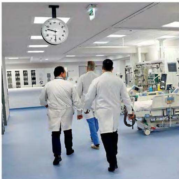
Σύμφωνα με την ΠΟΕΔΗΝ, το πρόβλημα της υποστελέχωσης έχει φέρει σε δύσκολη θέση τους διοικητές νοσοκομείων και ΥΠΕ στα νησιά της χώρας, οι οποίοι προσπαθούν ματαίως να πείσουν ιδιώτες γιατρούς να «βάλουν πλάτη» (φωτογραφία αρχείου).

Την ημέρα που έγινε η έρευνα φάνηκαν τα εξής για την Κρήτη: Μεγάλες ελλείψεις προσωπικού