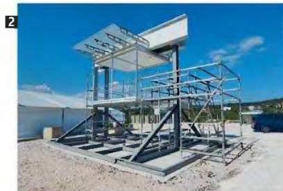
Στα δωμάτια του Παιδιατρικού Νοσοκομείου Θεσσαλονίκης υπάρχει κρεβάτι και για τον φροντιστή, δίπλα στο παιδί (1). Στο εργοτάξιο της Θεσσαλονίκης, η ομάδα του Ρέντσο Πιάνο δημιούργησε ένα ανοικτό εργαστήριο, όπου δοκιμάζονται τα υλικά σε κλίμακα 1:1 (2). Η όψη του Γενικού Νοσοκομείου Κομοτηνής, καλυμμένη με ξύλο από δέντρο ακόγια (3).