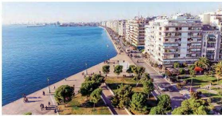
Οι μεγαλύτερες αυξήσεις στις τιμές ακινήτων καταγράφηκαν στη Θεσσαλονίκη.

Η περιορισμένη προσφορά νέων κατοικιών και το υψηλό κατασκευαστικό κόστος αναμένεται να συνεχίσουν να σπρίζουν τις τιμές, διατηρώντας όμως παράλληλα τις πιέσεις στην προστότητα της στέγης, ιδιαίτερα για τα νοικοκυριά χαμηλού και μεσαίου εισοδήματος. Για να υπάρξουν αμεσότερα αποτελέσματα στη διαθεσιμότητα κατοικιών, η έκθεση προτείνει την απλοποίηση των διαδικασιών μεταβίβασης και ανάπτυξης ακινήτων και κίνητρα για την επανένταξη ανενεργών ακινήτων στην αγορά.