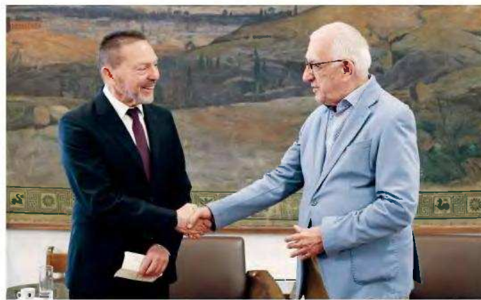
Ο Πρόεδρος της Βουλής, Νικότας Κακλαμάνης (δεξιά), δέχθηκε τον διοικητή της ΤτΕ, Γιάννη Στουράρα, ο οποίος του παρέδωσε την έκθεση της τράπεζας για τη νομισματική πολιτική.

Η έκθεση ενσωματώνει και ένα ευνοϊκότερο εναλλακτικό σενάριο, το οποίο βασίζεται στην πρόσφατη συμφωνία μεταξύ ΗΠΑ και Ιράν. Εφόσον η συμφωνία αυτή οδηγήσει σε οριστικό τερματισμό των