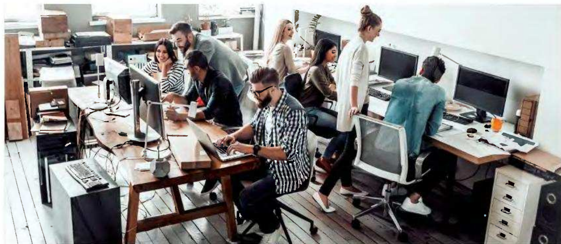
Στο τετράμηνο Ιανουαρίου-Απριλίου 2026 υπογράφηκαν 86 νέες επιχειρησιακές συμβάσεις και μόλις 32 από αυτές προβλέπουν αυξήσεις μισθών.