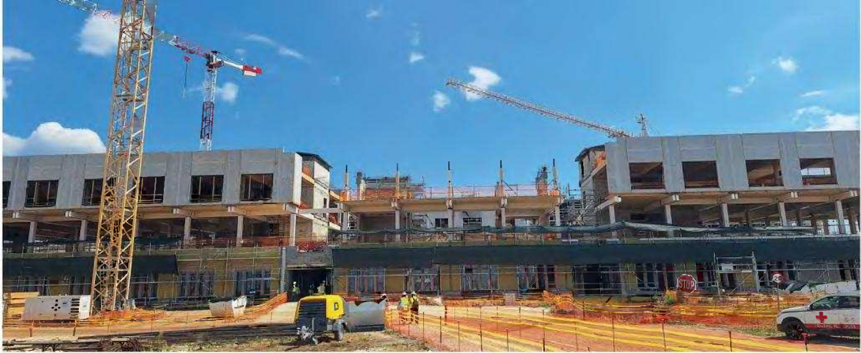
Το νέο Γενικό Νοσοκομείο Κομοτηνής λαμβάνει μορφή. Οι εργασίες ξεκίνησαν πριν από τρία χρόνια και ο ορίζοντας παράδοσης και των τριών νοσηλευτικών ιδρυμάτων είναι το 2027.